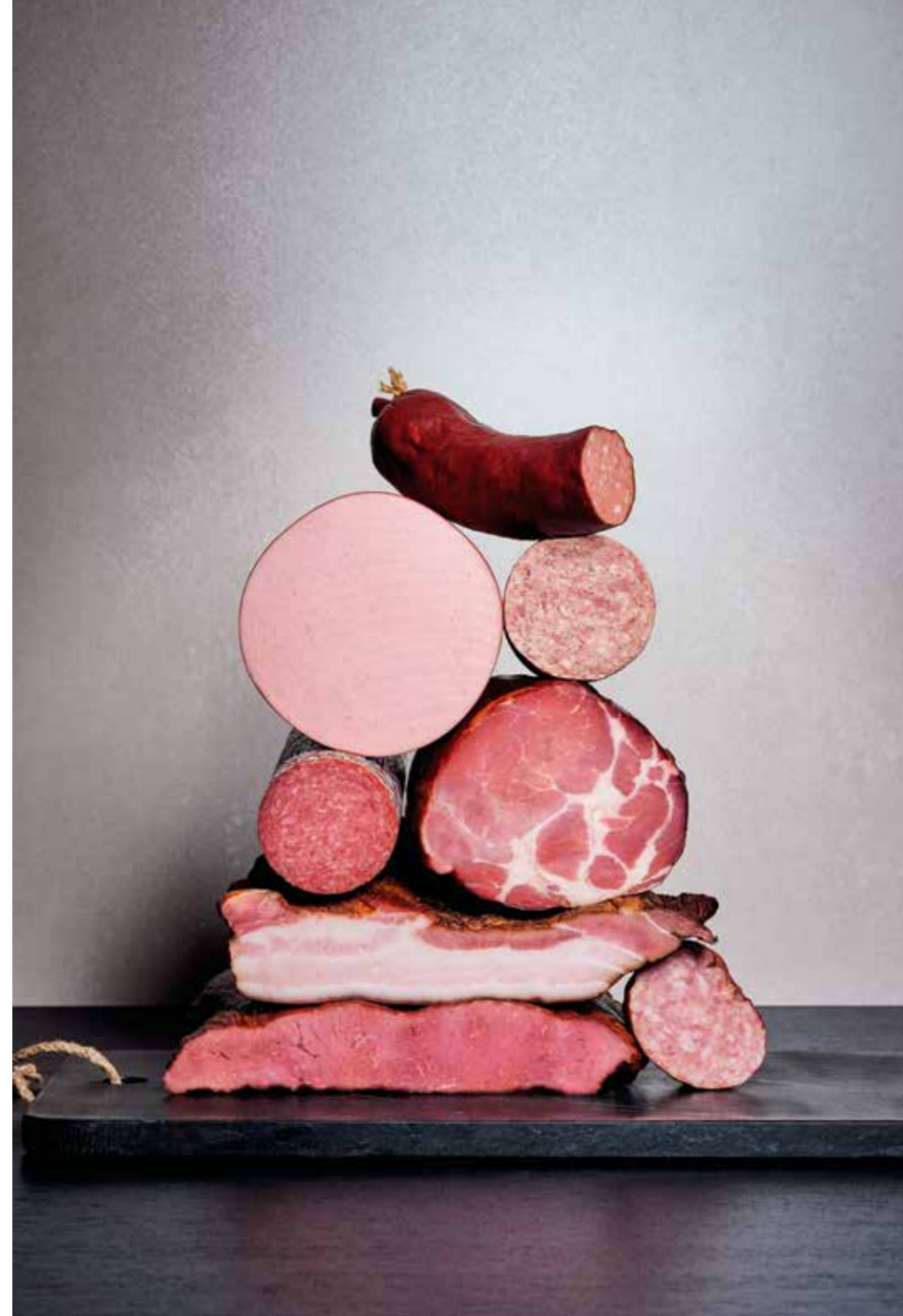
Zwei unserer Lieblinge von der Frühstückskarte: Links das herzhaftes „Turmfrühstück“ mit Moser Beinschinken und Hammerherrenspeck, rechts das hauchzarte „Französische Frühstück“