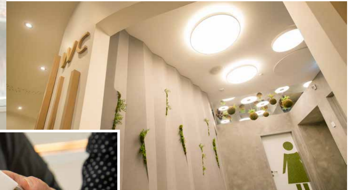
Vom Modell zur tatsächlichen Umsetzung: die Toilette im HAUBIVERSUM